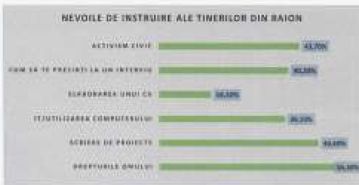
Figura 17. Neele de instruire ale tinerilor

Alte domenii, de care unii sunt preocupați, într-un număr mai mic sunt: oratoria și dezbaterile publice, limbi străine, psihologie și medicină, educație economică și voluntariat.