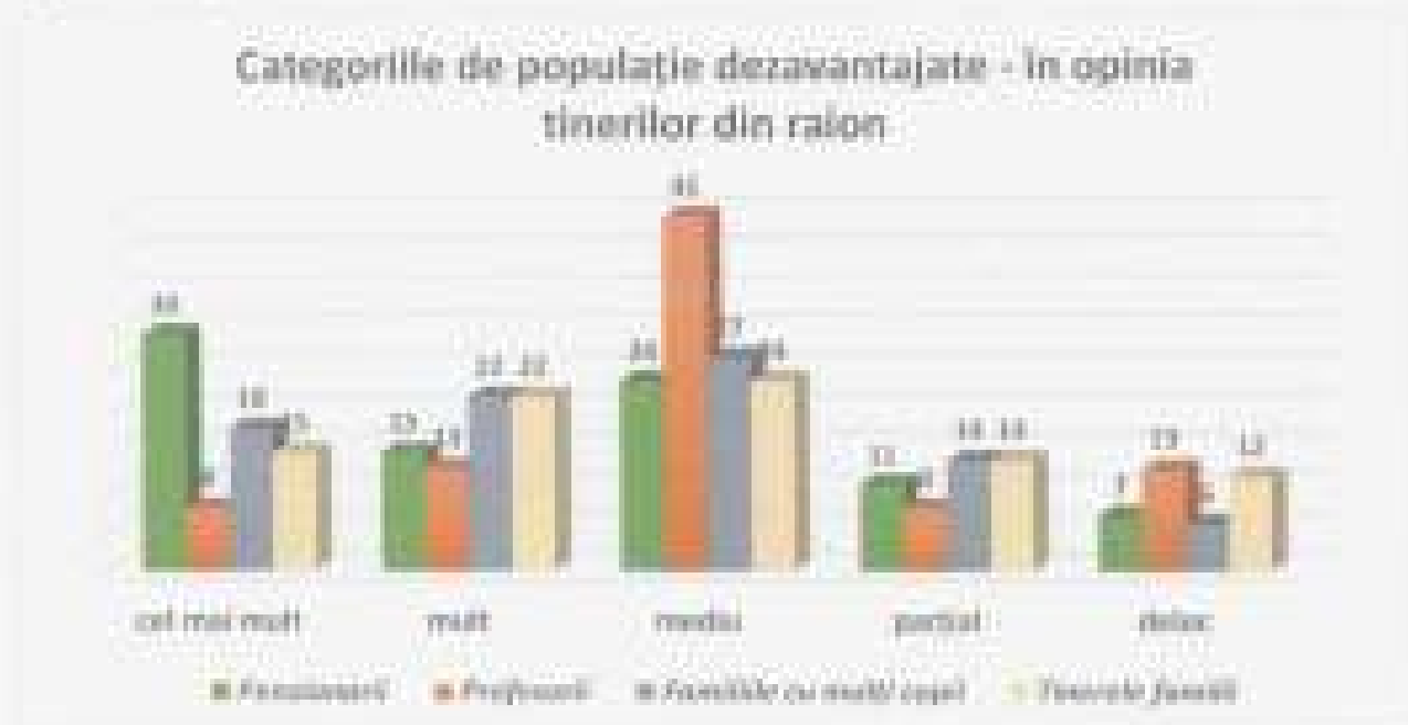
Figura 5. Categoriile de populație dezavantajate în viziunea tinerilor

Chiar și datele sondajului denotă că, cei care au mai mulți copii beneficiază de ajutoare financiare, suport bănesc, în timp ce familiile tinere, continuă să fie dependente de părinți, din simplul motiv că nu se descurcă singuri financiar cu cheltuielile zilnice.