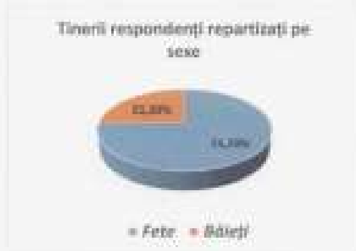
Figura 6. Repartizarea tinerilor din raionul Crâșeni, în funcție de sex:

Strategia respectivă se referă la toți tinerii, conform prevederilor legale, situația lor actuală în funcție de disponibilitatea datelor statistice pe diferite grupe de vârstă, sex și nivel de educație. Strategia abordează situația și politicile pentru tinerii cu vârsta cuprinsă între 16-35 de ani. Analiza este defalcată pe grupele de vârstă 16-20, 21-25, 26-30, 31-35, și respectiv pe sexe: fete și băieți.