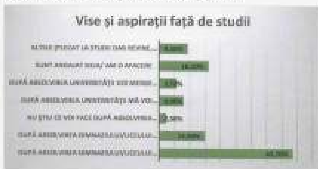
Figure 10. Aspirările tinerilor din Craiova, legate de studii

Cei care își fac studiile, chiar dacă și doresc să rămână în țară, le este destul de dificil să-și vadă viitorul aici, în local de naștere.