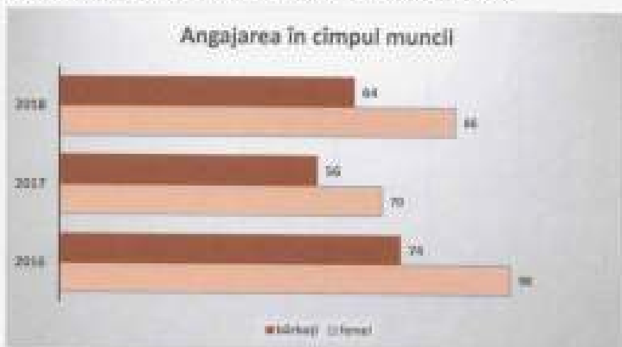
Figura 7. Număr de persoane din raionul Criuleni înregistrate oficial la ADFM

Este vizibilă scăderea numărului de persoane care apelează la serviciile ADFM pentru a-și găsi un loc de muncă. În rezultatul discuțiilor cu reprezentanții ADFM, una dintre cauze ar fi, asigurarea cu ajutor financiar din partea statului, pe mulți dintre tinerii care figurează în lista celor din grup vulnerabil. Pentru mulți dintre ei, este mai rentabil să primească ajutor și să rămână în condiții casnice, decât să meargă zilnic la serviciu.