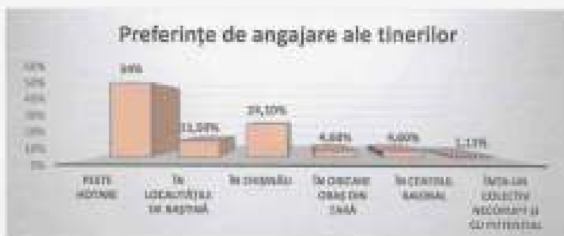
Figura 11. Preferințe de angajare ale tinerilor din raionul Criuleni

Domeniile de care sunt foarte interesați tinerii din raionul Criuleni și-au dovedit a fi: