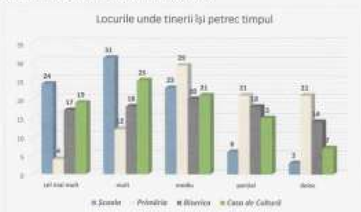
Figura 3. Locurile cele mai des frecventate de către tineri

Din discuțiile cu grupul de lucru, este important de menționat că mulți dintre tinerii își petrec timpul în cadrul Centrului UNIT și în Centrul Prietenos Tinerilor, unde practică diverse activități interactive.