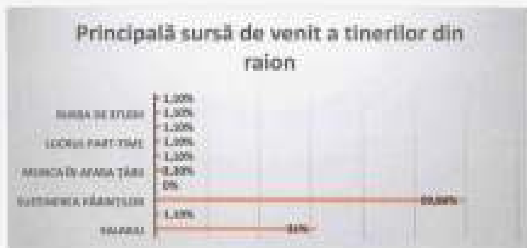
Figura 8. Venitul tinerilor din raionul Criuleni

Datele prezentate în figura de mai sus, confirmă cele spuse de tineri, precum că se simt jenati din cauza că sunt susținuți financiar de către părinți. Chiar dacă au reușit deja să facă o facultate, deși un loc de muncă, nu le ajung salariile nici măcar pentru strictul necesar (serviciile comunale, produse alimentare, produse de igienă).