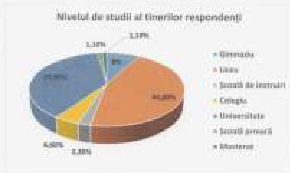
Figura 9. Studiile tinerilor rezpondenți

Tineri, care au fost rezpondenți în cadrul activităților realizate, au diferite niveluri de studii: